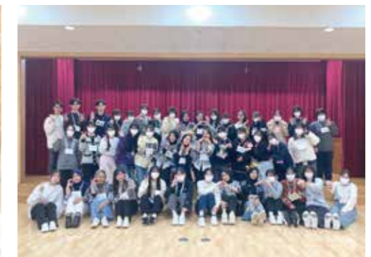
外国人技能実習生交流会