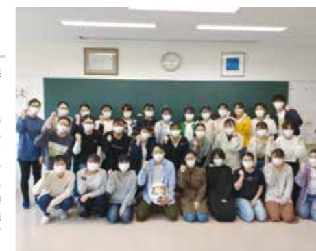
国家試験に向けて

各学年から役員を選出し、行事の企画・運営をしています。例年は決意式のお祝いや国家試験の激励、病院でのクリスマスボランティアなど実施していましたが、コロナ禍で限られる中、可能な範囲で工夫して行っています。