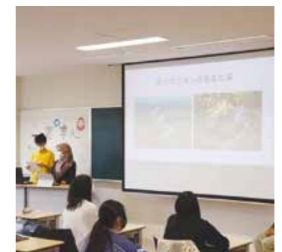
外国人技能実習生交流会