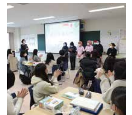
外国人技能実習生交流会

各学年から役員を選出し、行事の企画・運営をしています。例年は宣誓式のお祝いや国家試験の激励、病院でのクリスマスボランティアなど実施していましたが、コロナ禍で限られる中、可能な範囲で工夫して行っています。